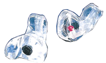
Exklusiverer Gehörschutz: Individuelle Anfertigung