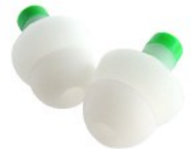
Klassischer Gehörschutz: Fertig geformter Ohrschutzstöpsel