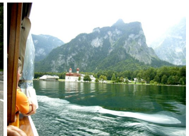
Blick auf die Wallfahrtskirche St. Bartolomä

Nach der Rückfahrt zum Hotel „Post“ in Seebruck lassen wir den wunderschönen Tag bei einem Gläschen Wein ausklingen und entscheiden uns, am nächsten Tag die Kampenwand in Angriff zu