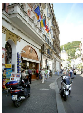
Unser Ziel das Hotel „Kucera“