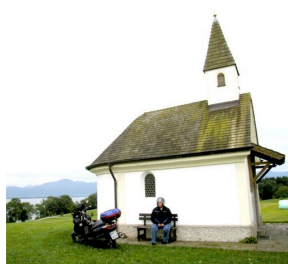
Kleine Kapelle am See

Die restlichen Urlaubstage am Chiemsee dienen in erster Linie der Erholung, aber wir unternehmen