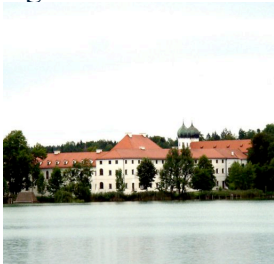
Das Kloster Seonon