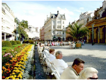
Auf der Kurpromenade