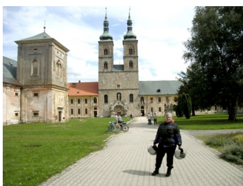
Das Stift in Tepl