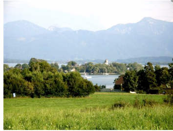
Blick auf die Fraueninsel