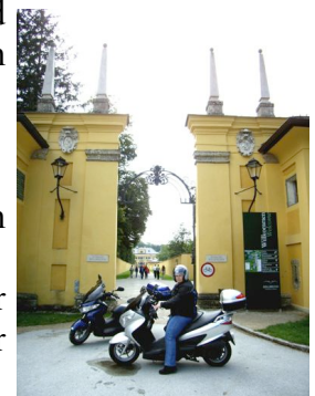
Rast vor dem Schlosspark Hellbrunn

Die erste Tour dient noch dazu, die Vorliebe meiner Frau für Zoo-Besuche zu befriedigen und so fahren wir über Traunstein und Freilassing in den Salzburger Zoo und in den sehr schönen Park des Schloss Hellbrunn.