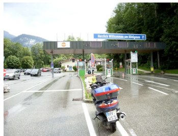
Ohne Moos nichts los - Mautstelle am Königssee

vorhandenen Souvenirläden meiden wir und gönnen uns dafür lieber ein kräftiges Mittagessen. Die anschließende Fahrt mit einem der lautlosen Elektroboote über den fjordartigen See, vorbei an der Echowand, bis zur Wallfahrtskirche St. Bartolomä ist zwar nicht ganz billig, aber der Blick auf die den See umgebenden Bergriesen beeindruckt - fast 1800 m hoch ragt die Watzmann-Ostwand über dem See auf.