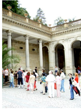
Die Mühlbrunnkolonnade und die Russisch-Orthodoxe Kirche St. Peter u. Paul