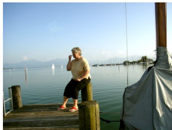
Abendstimmung am Chiemsee

Landschaft begeistert. Die letzten Sonnenstrahlen spiegeln sich auf der Wasseroberfläche und im Hintergrund einige weiße Segel vor den Gipfeln der Chiemgauer Alpen – die perfekte Kulisse für einen erholsamen Urlaub und natürlich auch für Rollertouren auf zahlreichen kurvigen und bergigen Sträßchen.