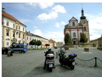
Fotopause auf dem Marktplatz in Bor

Nach einer Woche hieß es wieder packen und Abfahrt zum nächsten Urlaubsziel, dem Hotel „Kucera“ im tschechischen Karlovy Vary. Der Route führte über reichlich 300 km ganz unspektakulär über die B20 bis zum Grenzübergang Furth im Wald, anschließend durch Bor und vorbei an Marianske Lazne. Einen kurzen Umweg war uns der Besuch des Stift Tepl (tschechisch