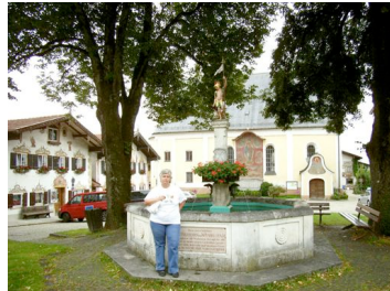
Neubeuern – ein oberbayerisches Dorf wie aus dem Bilderbuch