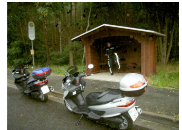
Der große Regen kommt

Wir entschieden uns deshalb für das bayerische Meer, den Chiemsee. Bereits kurz nach Fahrtbeginn begann es zu Regen und da auch keine Wetterbesserung in Sicht war, entschieden wir uns für die Autobahn. Der Regen wurde zeitweise so stark, dass wir unsere Geschwindigkeit erheblich drosseln mussten. Nach reichlich 500 km Regenfahrt wurde es kurz vor dem Ziel heller und Seebruck empfing uns mit Sonnenschein. Schon beim ersten Bummel am See sind wir von der reizvollen