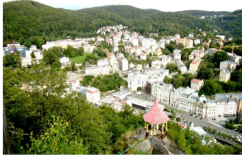
Blick vom „Hirschsprung“ auf Karlovy Vary