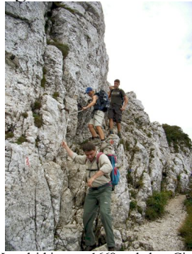
Kraxelei bis zum 1668 m hohen Gipfel