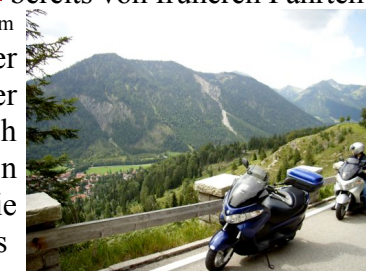
Auffahrt zum Sudelfeld

Die Wallfahrtskirche Maria Klobenstein und die Entenlochklamm auf eine Stadtrunde, fahren lieber auf der Landstraße weiter zum Thiersee und über den Ursprungpass (849 m) zurück nach Deutschland. In Bayrischzell schwenken wir auf die B305 und erreichen schnell die Passhöhe Sudelfeld 1123 m). Schade dass wir den unscheinbaren kleinen Abzweig zum