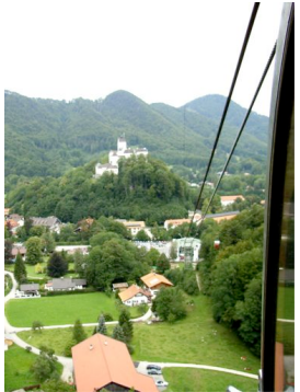
Das Schloss Hohenaschau

Nach der Rückfahrt zum Hotel „Post“ in Seebruck lassen wir den wunderschönen Tag bei einem Gläschen Wein ausklingen und entscheiden uns, am nächsten Tag die Kampenwand in Angriff zu