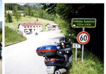
Die Passhöhe ist erreicht