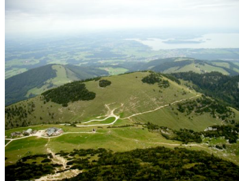
Blick von der Kampenwand in Ri. Chiemsee

nehmen. Bereits am frühen Morgen starten wir Richtung Aschau mit einem kurzen Abstecher zur Seiser Alm (die gibt's also nicht nur in Südtirol), Die Aussicht von der Terrasse des dort befindlichen Restaurants auf den Chiemsee ist toll. In Aschau steigen wir um in die Kampenwand-Bergbahn und fahren hinauf.