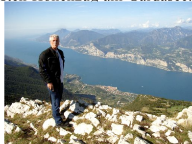
Die Aussicht von der Bocca Tratto Spino

Auf der Fahrt passierten wir Riva, Torbole und den wohl „höchsten Pass der Alpen“, den Passo S. Giovanni – ganze 287 m hoch. Ab Mori schraubte sich die kurvenreiche Straße immer höher die Nordrampe des Monte Baldo empor. Die Fahrt führt durch eine wunderschöne Landschaft mit Wäldern und weiter Almlandschaft. An der Bocca di Navenna gibt es ein kleines Restaurant, von dessen Terrasse man einen wunderschönen Ausblick auf den Gardasee hat. Wenig später erreicht man einen Parkplatz am rechten Straßenrand. Ein Fußweg führt von hier aus zur Bergstation Bocca Tratto Spino in 1783 m Höhe. Der Weg hinauf war zwar ganz schön schweißtreibend, aber die Aussicht auf den Gardasee und die Alpen dafür unvergleichlich.