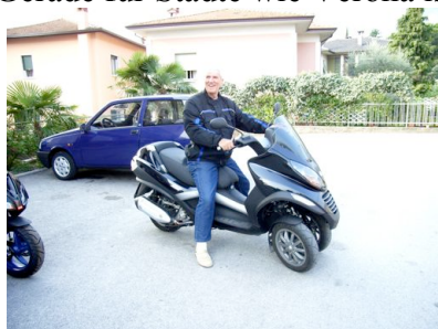
Probefahrt mit dem neuen Piaggio MP3 in Arco