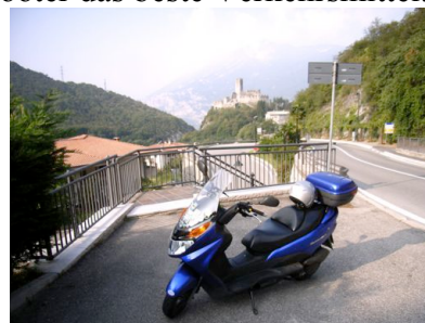
Im Hintergrund die mittelalterliche Burg Drena