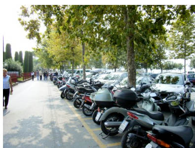
Ja wo sind denn unsere Roller?

Über Spiazzi und S. Zeno, wo wir uns noch einen leckeren Eisbecher gönnten, gelangten wir nach Torri del Benaco, einem der ältesten Orte am Gardasee. Auf der Gardesana Orientale, der östlichen Küstenstraße, ging's wieder zurück nach Limone.