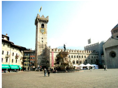
Der Domplatz mit dem Neptunbrunnen