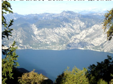
Blick von der Bocca di Navenna auf den Gardasee