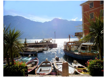
Der alte Hafen in Limone

Die letzten 15 km bis zum Hotel in Limone sul Garda absolvierten wir auf der westlichen Uferstraße, der Gardesana occidentale. Limone hat nur wenig Platz, da am nordwestlichen Ufer die Berge hoch aufragen und steil in den See abfallen. Die kleine Altstadt von Limone drängelt sich deshalb auf engstem Raum und in ihren Gassen lässt es sich gut bummeln – vorausgesetzt man besucht Limone außerhalb der Hochsaison.