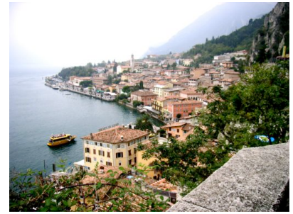
Das Urlaubsziel Limone sul Garda

Die letzten 15 km bis zum Hotel in Limone sul Garda absolvierten wir auf der westlichen Uferstraße, der Gardesana occidentale. Limone hat nur wenig Platz, da am nordwestlichen Ufer die Berge hoch aufragen und steil in den See abfallen. Die kleine Altstadt von Limone drängelt sich deshalb auf engstem Raum und in ihren Gassen lässt es sich gut bummeln – vorausgesetzt man besucht Limone außerhalb der Hochsaison.