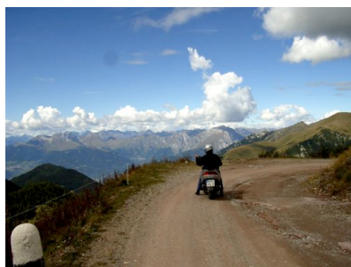
9 km Schotterpiste bis zum...