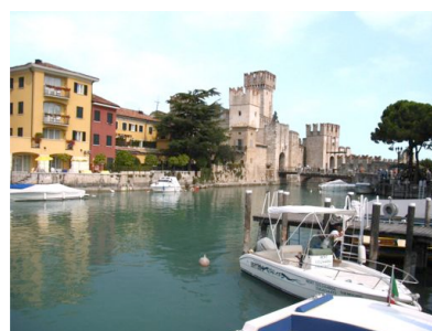
Vor den Toren von Sirmione