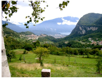
Der Gardasee ist erreicht