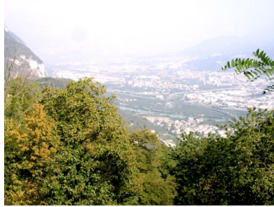
Blick auf das Etschtal und die Ausläufer von Trient

Ein weiterer Ausflug galt Trient, der Provinzhauptstadt des Trentino. Der Weg dorthin führte zunächst nach Arco, deren Stadtbild vom hohen Burgberg beherrscht wird. Hier in Arco hatte ich auch die Möglichkeit eine erste Proberunde mit dem neuen Piaggio MP3 zu drehen.