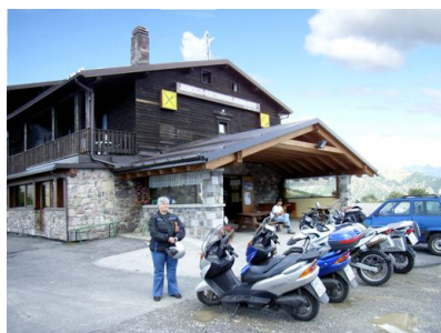
Rast auf dem Pso. Dosso Alto (1725)

ständig enger werdenden Kehren boten sich phantastische Ausblicke auf den Idrosee. Kurz vor dem Gipfel zwang uns leider die durch einen Erdbeben unpassierbare Straße zur Umkehr. Nach einem Umweg auf übler Asphaltpiste und einer Pause in der Passwirtschaft Dosso Alto erreichten wir den Passo Maniva (1662 m). Danach verwandelt sich die Straße in eine Schotterpiste mit Spurrinnen, Schlaglöchern, großen Pfützen und sonstigen Gemeinheiten.