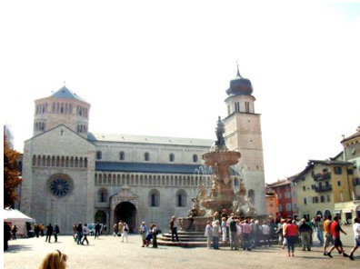
Der Dom San Vigilio in Trient

Weiter ging unsere Fahrt dann bis Dro, wo wir nach rechts abbogen und nachdem wir das Castello Drena passiert hatten, begann die Fahrt über den Monte Bondone. Kehre auf Kehre folgten fast endlos und dazwischen boten sich dann auf der Abfahrt auch immer wieder schöne Ausblicke auf das Etschtal und die Ausläufer Trients.