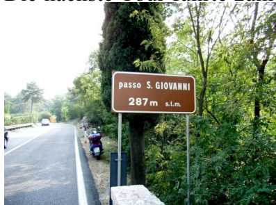
Der wohl „höchste Pass“ der Alpen – 287 m hoch

Die nächste Tour führte zum Monte Baldo, dem wohl großartigsten Höhenzug am Gardasee.