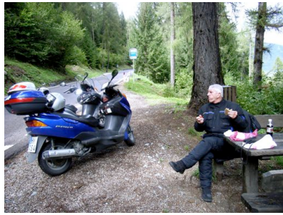
Rast, vor dem Pso. Campo Carlo Magno