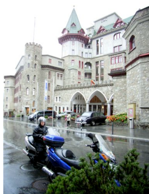
Regen in Sant Moritz