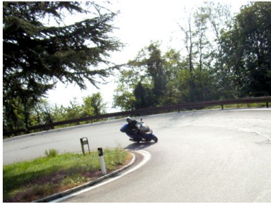
Im Kurvenrausch – auf dem Monte Bondone

Werden wir auf unseren Rollertouren auch hin und wieder von Autofahrern belächelt, spätestens bei der Parkplatzsuche lächeln wir dann. Zweiradparkplätze sind in Deutschland meist noch ein Fremdwort, aber in Italien gibt es reichlich davon, so dass unsere Roller immer ein Plätzchen fanden.