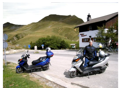
Pso. Croce Domini (1892 m)N