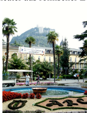
Arco, im Hintergrund der Burgfelsen