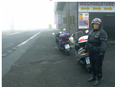
Der Fichtelberg empfing uns mit Nebel

Nachdem wir mehrere Jahre gemeinsam mit dem Motorrad wunderschöne Touren unternommen hatten, kam mir die Idee, meine Frau könne doch eigentlich auch selbst fahren. Da sie aber nur im Besitz des Führerschein für Motorräder bzw. Roller bis 125 ccm war, blieb nur die Möglichkeit, von meiner geliebten BMW wenigstens vorübergehend auf einen 125er Roller umzusteigen. Gesagt, getan und so starteten wir im September 2003 zur ersten gemeinsamen Rollertour. Wenn schon nur noch maximal 100 km/h, dann wenigsten reichlich Kurven – also wählten wir das Kurvenparadies, die Dolomiten, als Ziel dieser Tour. Für meine Frau, die bisher mit ihrem Roller kaum die Stadtgrenzen verlassen hatte, war die Tour schon ein gewaltiger Brocken. Um es vorweg zu nehmen, sie hat sich hervorragend geschlagen und nach unserer Rückkehr sogar noch Lust auf weitere Rollertouren.