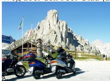
Auf dem Passo Giau

auch der Blick über den See auf das Bergmassiv der 3 Zinnen. Für die Rückfahrt hatten wir den Weg über den Pso. Giau (2233 m) gewählt. Unter den vielen Pässen der Dolomiten gibt es viel