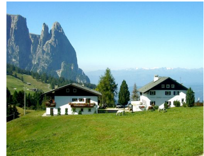
markante Felsen, Burgstall, Euringer- u. Santner Spitze

ab zum Grödner Joch (2121 m). Das herrliche Wetter verleitete immer wieder zu einem Sonnenbad vor der wunderschönen Bergkulisse. Die Fahrt führte weiter über Corvara zu den nächsten Pässen, dem Pso. di Campolongo (1875 m) und zum Pso. Pordoi (2239 m). Auf der Passhöhe unter-