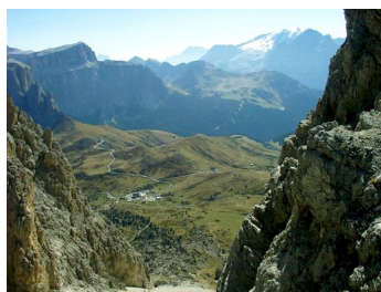
Blick von der Langkofelscharte