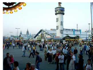
Auf dem Münchener Oktoberfest