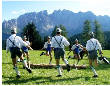
Folklore vor der Kulisse des Rosengarten

Zur ersten Ausfahrt starteten wir wieder durch das Eggental in Richtung Bozen, anschließend durch das Eisacktal und danach zum ersten Ziel, der Seiser Alm, der größten Hochalm Europas. Nach einer Cappuccini-Pause ging's wieder runter nach Kastelruth, St. Ulrich und St. Christina. Hinter Wolkenstein bogen wir rechts