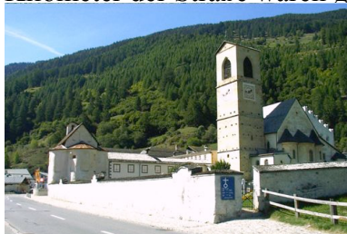
Das Kloster Müstair im Münstertal

aber trotzdem problemlos zu befahrender Abschnitt. Zahlreiche, teilweise einspurige Kurven führten hinab in das Münstertal. Das Kloster Müstair war noch eine Pause wert, bevor wir uns auf die Rückfahrt machten. Allerdings wählten wir ab Bozen nicht den direkten Weg nach Welschnofen, sondern zweigten in Blumau rechts ab, um durch 13 dicht aufeinander folgende Spitzkehren hinauf nach Steinegg zu gelangen. Dort erwartete uns ein atembe-