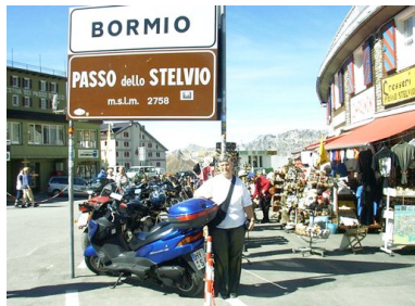
...zum Glück – Hurra ich hab's geschafft!

Frau an das berühmte Stilfser Joch, der unangefochtenen Königin der Passtrassen. Am frühen Morgen starteten wir und erreichen nach ca. 100 km Sondigna, wo wir links in Richtung Gornagoi abbogen. Hinter Trafoi kommt die erste von 48 Spitzkehren, die unsere volle Aufmerksamkeit forderten. Auch meine Frau kam zunächst ganz gut zurecht. Erst als ihr in einer Rechts-