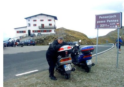
Auf dem Penser-Joch (2211 m)

Dolomiten vor uns. Die Reise führte bei ziemlich miesen Wetter durch München, vorbei am Kochel- und Walchensee, durch Seefeld und nach einer Pause weiter bis Sterzing. Hier bogen wir rechts ab und strebten dem Penser Joch (2211 m) entgegen. Die Auffahrt war relativ einfach zu fahren, und auch die Abfahrt hinein ins Sarntal wies kaum schwierige Kurven auf, die besondere Aufmerksamkeit erforderten. Trotzdem war es, jedenfalls für meine Frau, ein besonderes Erlebnis, hatte sie doch den ersten 2000er Pass allein überquert. Kurz vor Bozen wurde es etwas interessanter, da hier die Trasse durch mehrere Tunnel führte. Nach einer „Ehrenrunde“ durch Bozen fanden wir