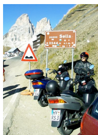
Auf dem Sella-Pass.

berte uns allerdings noch das Gebirgsmassiv des Rosengarten und auch der Karersee mit einem Blick auf das Latemar-Massiv war eine Pause wert. Eine weitere Tour führte zunächst in einer relativ anspruchsvollen Auffahrt mit zahlreichen Haarnadelkurven hinauf zum Sella-Pass (2244 m), wo wir unsere Roller parkten und mit der Seilbahn weiter zur 2785 m hoch gelegenen Langkofelscharte fuhren. Das Panorama von dort oben war vom Feinsten. Wieder unten ging's hinunter nach Canazei, links ab zum Fedaia-Pass (2056 m) und zum türkis schimmernden Fedaia-Stausee, anschließend in Richtung Cortina d'Ampezzo und zum malerisch 1756 m hoch gelegenen, Misurina-See. Besonders reizvoll war