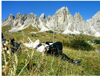
Sonnenbad auf dem Grödner Joch

ab zum Grödner Joch (2121 m). Das herrliche Wetter verleitete immer wieder zu einem Sonnenbad vor der wunderschönen Bergkulisse. Die Fahrt führte weiter über Corvara zu den nächsten Pässen, dem Pso. di Campolongo (1875 m) und zum Pso. Pordoi (2239 m). Auf der Passhöhe unter-