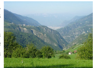
Blick von Steinegg in Richtung Bozen

beraubender Blick auf den Rosengarten, das Latemar und das im Tal liegende Bozen. Bis zum Hotel war es von hier aus nicht mehr weit.