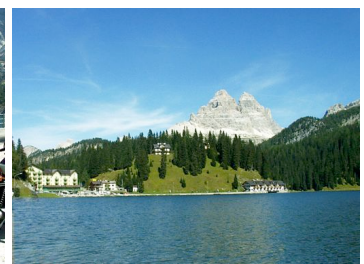
Der Misurina-See mit Blick auf die 3 Zinnen

auch der Blick über den See auf das Bergmassiv der 3 Zinnen. Für die Rückfahrt hatten wir den Weg über den Pso. Giau (2233 m) gewählt. Unter den vielen Pässen der Dolomiten gibt es viel