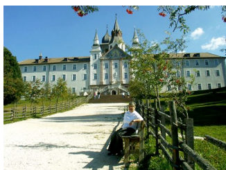
Das Kloster Weisenstein

In dieser Woche besuchten wir noch bei einigen Touren u. a. den Nigersattel, den Passo di Lavaze (1808 m), das sich anschließende Val di Fiemme, Cavalese und auch das Kloster Weisenstein. Dann galt es Abschied zu nehmen und das nächste Ziel, München anzu- steuern. Wir wählten dazu den Weg durch das Eisacktal, über den Brenner, Richtung Innsbruck und Garmisch-Partenkirchen. Da wir lieber die Landschaft genießen wollten, mieden wir die Autobahn. Zum Glück war die Hauptsaison vorbei und außerdem Sonnabend, so dass nur wenige LKW's unterwegs waren. Nur einige Wohnmobile und PKW-Gespanne zwangen uns ab und zu zum hinterher Bummeln. Trotzdem