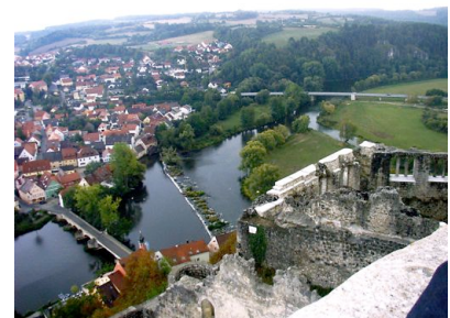
Blick von der Burgruine Kallmünz auf die Naab

Am nächsten Tag lagen noch einmal reichlich 400 km bis zu unserem Ziel, dem Gasthof Schönwald in den