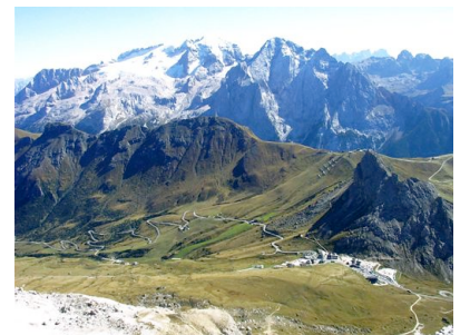
Blick vom Sass Pordoi auf's Marmolada-Massiv

nahmen wir noch eine Seilbahnfahrt auf den 2950 m hohen Sass Pordoi, von wo man eine Superaussicht auf das ewige Eis der Marmolada (3343 m) hat. Die Rückfahrt zum Hotel erfolgte durch das Fassatal, hinauf zum Karerpass (1745 m) und in zahlreichen Kurven wieder zurück nach Welschnofen. Vorher bezau-