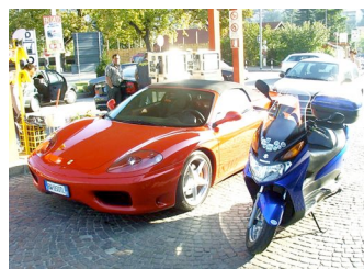
Treffen an der Tankstelle